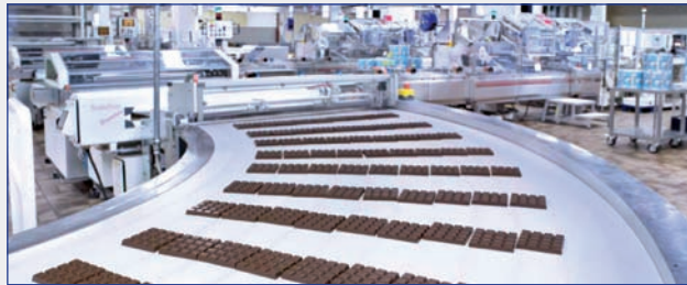
Ritter Sport Schokoladenproduktion

Gegründet 1912, ist Ritter-Sport nach wie vor fest in schwäbischer Familienhand. Rund 800 Mitarbeiter arbeiten am einzigen Standort Waldenbuch in Verwaltung und Produktion . Geliefert werden die Schokoladenspezialitäten mittlerweile in rund 90 Länder auf der ganzen Welt.