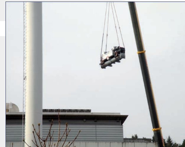
Einbringung einer der 30XW Aquaforce mit Hilfe eines Krans ...

Mit diesen Anforderungen wurde der neue, energieeffiziente Maschinenpark konzipiert. Während die Leistung bei der Soleanwendung heruntergefahren wurde, wurde sie bei der Klimatisierung leicht erhöht. Als Alternative zu den Carrier-Maschinen für die Soleanwendung war kurzzeitig eine Ammoniak-Lösung im Gespräch. Diese Lösung wäre energetisch gut gewesen, hätte aber u.a. Geruchsbelastung, erhöhte Sicherheitsvorschriften und Mitarbeiterschulungen mit sich gebracht. Ohne diese Nachteile und zusätzlich mit einem überragend hohen System-EER* überzeugten letztendlich doch die Maschinen von Carrier.