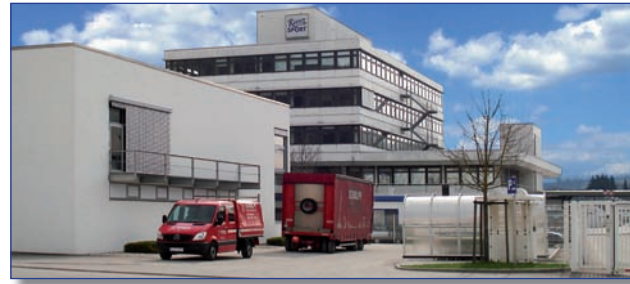
Das Ritter Sport Gelände in Waldenbuch

Der komplette Neuaufbau der Kältetechnik ermöglichte es, die aktuellste und fortschrittlichste Carrier-Technik zu verbauen. Zugleich konnte auch die bewährte Schraubenkältemaschine als Backup-Lösung integriert werden. Neben der konzeptionellen Umsetzung des Projektes, inklusive Wirtschaftlichkeitsberechnung und der Möglichkeit zur Energieverschiebung, der Zuverlässigkeit der Maschinen, den bewährten Serviceleistungen und der umfassenden Monitoring- / Energie-Controlling-Lösung hat Ritter Sport vor allem eines überzeugt: Das alles aus einer Hand zu bekommen.