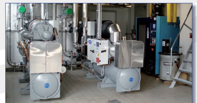
Eine der Kältezentralen