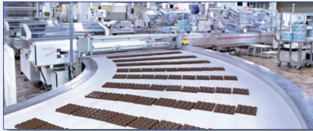
Ritter Sport Schokoladenproduktion

Gegründet 1912, ist Ritter-Sport nach wie vor fest in schwäbischer Familienhand. Rund 800 Mitarbeiter arbeiten am einzigen Standort Waldenbuch in Verwaltung und Produktion . Geliefert werden die Schokoladenspezialitäten mittlerweile in rund 90 Länder auf der ganzen Welt.