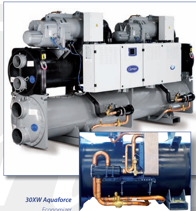
30XW Aquaforce Economizer