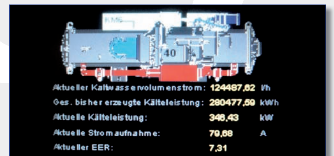
Ansicht der Leistungsdaten

Ein weiterer wichtiger Aspekt bei Ritter-Sport war der Wunsch nach einem zeitgemäßen Energie-Controlling : ein Fall für die Regelungsabteilung. Carrier Controls regelt komplett Kaltwasser und Luft und wurde via bacnet an die Gebäudeleittechnik von Siemens angebunden. Als Monitoringlösung wurde ein Webserver mit detaillierter Anlagensvisualisierung sowie Fernwahl inkl. Alarmumschaltung, Trendaufzeichnung, Reservepumpenschaltung sowie Erfassung des Ladezustands der Puffer installiert. Mit dieser „Deluxe-Lösung“ haben die Techniker von Ritter-Sport jederzeit einen umfassenden Einblick und alle Funktionen und Leistungswerte der Anlage im Blick.