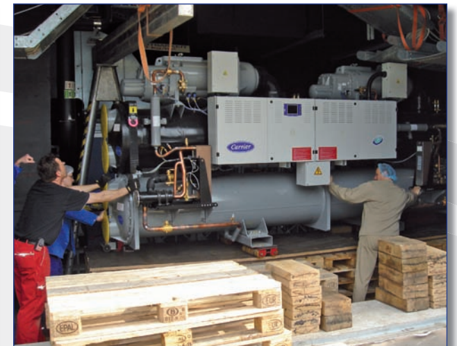
... und mit Hilfe der Carrier-Techniker

Noch während der Planungsphase kam es allerdings zum Ausfall alter Maschinen, so dass ein gleichzeitiger Austausch aller Geräte nicht wie geplant durchgeführt werden konnte. In solchen Fällen springt unsere Schwesterfirma CRS (Carrier Rental Systems) ein. Eine 30RB mit 600kW wurde bis zur Lieferung der neuen Maschinen als Leihkältemaschine installiert. Die Produktivität von Ritter-Sport war somit jederzeit gewährleistet.