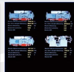
Gesamtansicht der Leistungsdaten der Kältezentrale